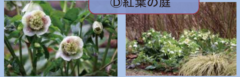
○ クリスマスローズ (④紅葉の庭、③南館前タブの丘など)