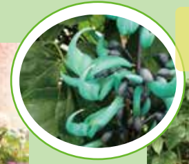
神秘的な花色のお花です。