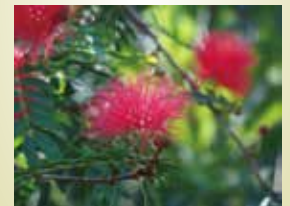
キャリアンドラ (スロープ横、階段横)