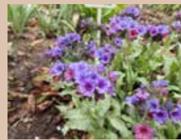
プルモナリア (回廊側)