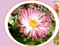
◆ デージー (⑧霧の庭園)