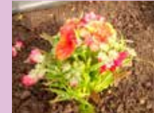
■ ネメシア (南館通り)