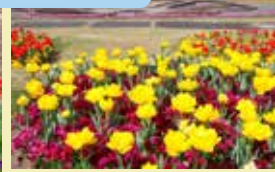
①花の谷、①ヨーロッパガーデン、⑧霧の庭園など