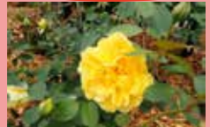
ゴールデンセレブレーションなど