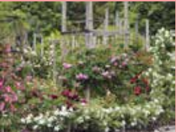
つるバラのタワー