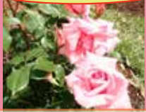
プリンセスアイコなど