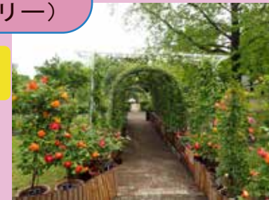
つるバラのアーチトンネル